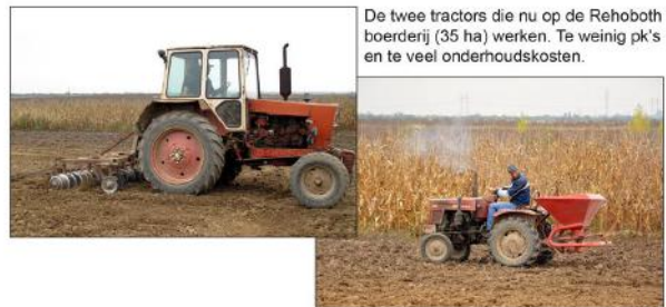
De twee tractoren die nu op de Rehoboth boerderij (35 ha) werken. Te weinig pk's en te veel onderhoudskosten.