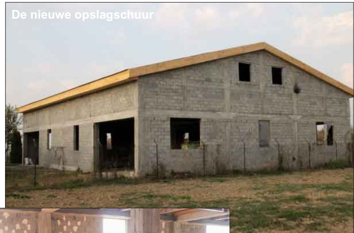
De nieuwe opslagschuur