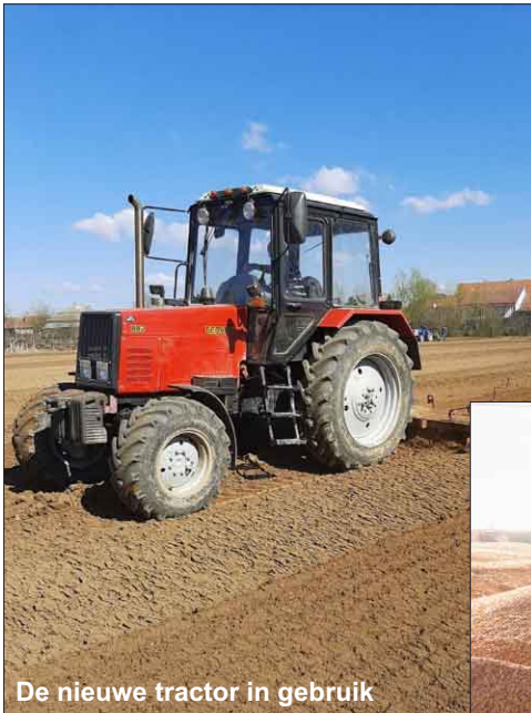
De nieuwe tractor in gebruik

In 2020 is er veel aandacht geweest voor het boerderijproject. Er werden verschillende gewassen geteeld: aardappelen, tarwe, maïs en haver. De oogst was dit jaar goed en men heeft een aanvang gemaakt met de teelt van tomaten en paprika's. Er konden ook verschillende materialen en machines worden aangeschaft. Op het terrein van Rehoboth is men bezig met de bouw van een schuur. De muren en het dak zijn aanwezig. Later, als er meer tijd is, zal deze schuur worden afgebouwd.