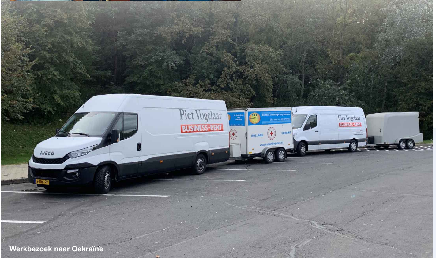
Werkbezoek naar Oekraïne