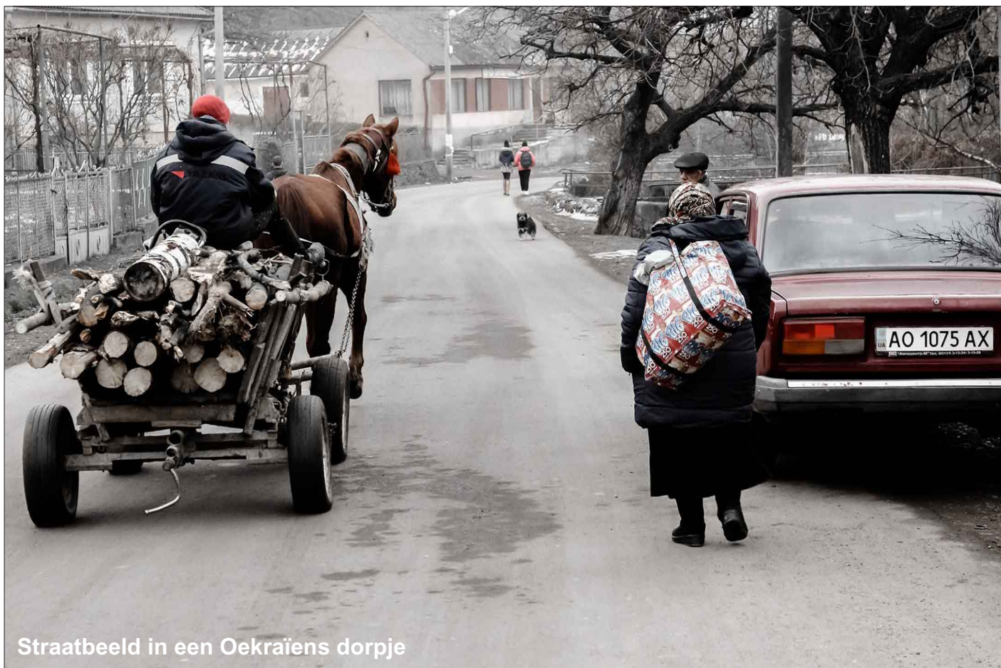
Straatbeeld in een Oekraïens dorpje