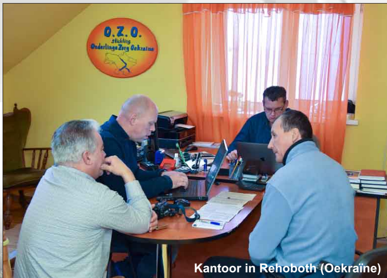
Kantoor in Rehoboth (Oekraïne)