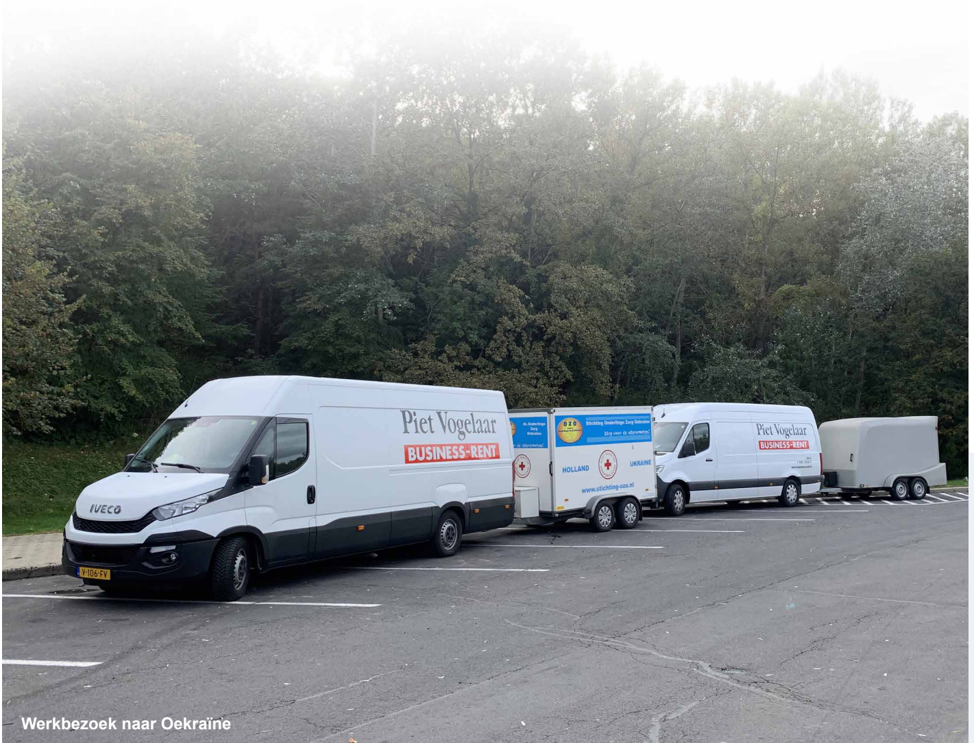
Werkbezoek naar Oekraïne