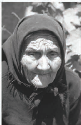
Arm en alleen op de wereld, maar dankbaar voor uw hulp

Mede dank zij uw gift, in welke vorm dan ook, worden op dit moment 21 arme alleenstaanden of arme gezinnen bezocht en naar behoefte van voedsel voorzien.