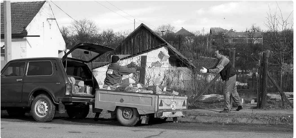
Met een auto en aanhanger vol met stukken boomstam rijdt Jenö langs de adressen. Waar nodig krijgen de ouderen brandhout voor de winter.