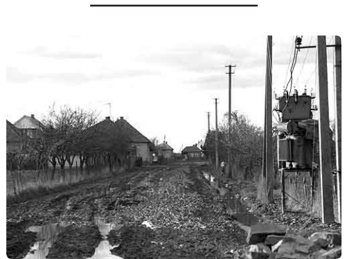
Zomaar een foto van een willekeurige dorpsstraat.....

Ook zullen toekomstige bewoners voor opname in 'Rehoboth' zelf meebetalen, als blijkt dat zij uit verkoop van eigen bezittingen (huis, grond, e.d.) gelden verworven hebben. Uiteraard zal dit beoordeeld worden naar ieders vermogen. Maar in eerste instantie is St. OZO volledig verantwoordelijk voor het financiële reilen en zeilen van de instelling. Of het gebouw nu bijna klaar is? We zijn net zo nieuwsgierig als u en we hopen u na het aanstaande werkbezoek van eind september weer meer te kunnen berichten!