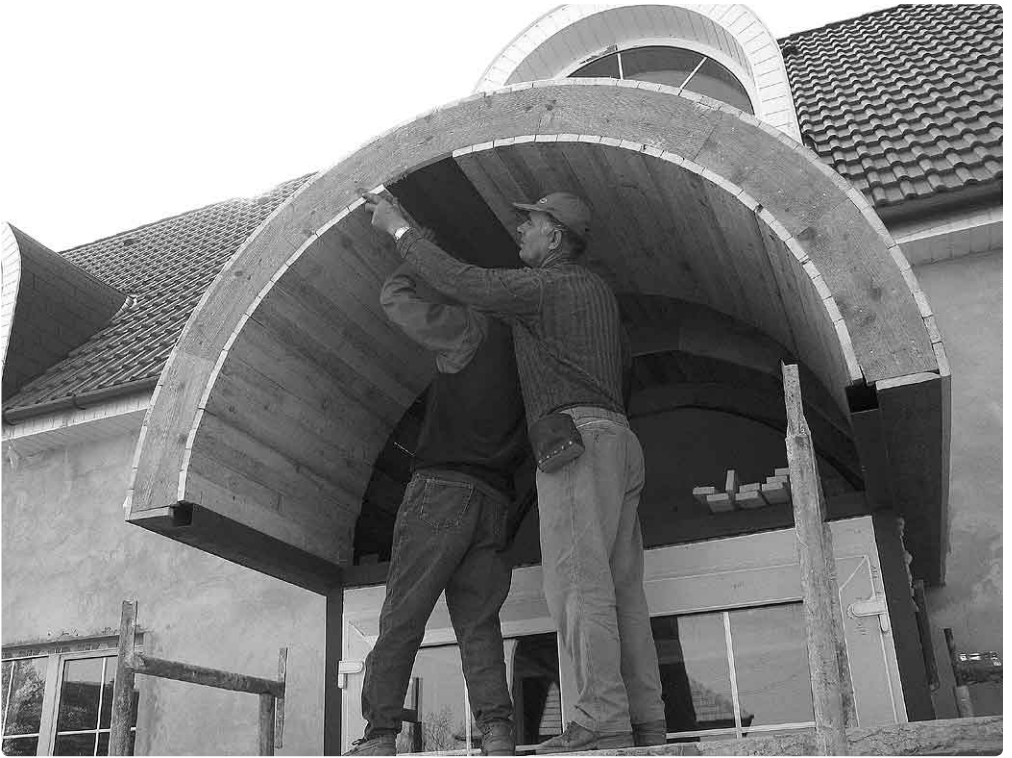
De entree van 'Rehoboth'. De timmermannen genieten zichtbaar van het maken van de kap.