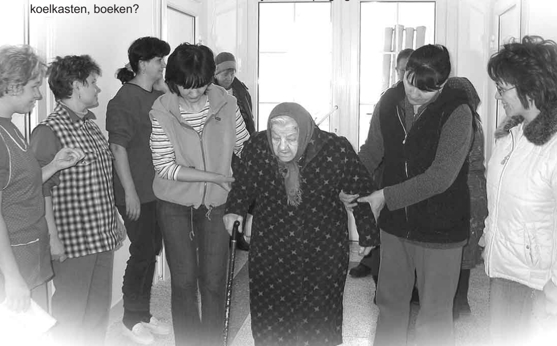
Omgeven door belangstellende personeelsleden arriveren de eerste bewoners in 'Rehoboth'

Daar rinkelt de telefoon. Telefoon?? Jawel, een heuse telefoon, waarmee u gerust even naar uw oude broer kunt bellen. Een dokter? Medicijnen? Verpleging? Ook wasmachines, vrieskasten, koelkasten, boeken?