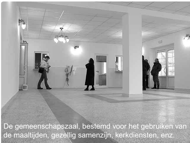
De gemeenschapszaal, bestemd voor het gebruiken van de maaltijden, gezellig samenzijn, kerkdiensten, enz.

Met de hulp van God én úw hulp gaan wij welgemoed verder met het werken aan de projecten. Hierbij moet worden aangemerkt dat het de eerste prioriteit is om ervoor te zorgen dat elk project bestaansrecht kan hebben. Dit betekent concreet: een financiële buffer opbouwen voor het in bedrijf zijn en blijven van 'Rehoboth', en daarbij zorgvuldig de andere projecten te continueren, indien mogelijk uit te breiden. Nu al zes jaar geven particulieren, bedrijven, kerken en instellingen blijk van hun grote betrokkenheid bij het werk van St. OZO. Mogen wij u oproepen dit te blijven doen in de toekomst? U weet het: we doen het niet voor onszelf, maar voor onze arme naaste!