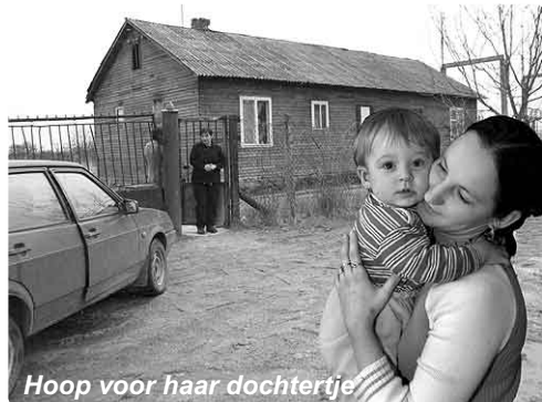
Hoop voor haar dochtertje

gehouden en de diaconale stichting 'Talentum' schenkt ook een bedrag. St. OZO zal het restbedrag aanvullen, zodat deze peuter een hopelijk geslaagde operatie zal kunnen ondergaan. U kunt zich voorstellen dat haar ouders weer hoop kregen!