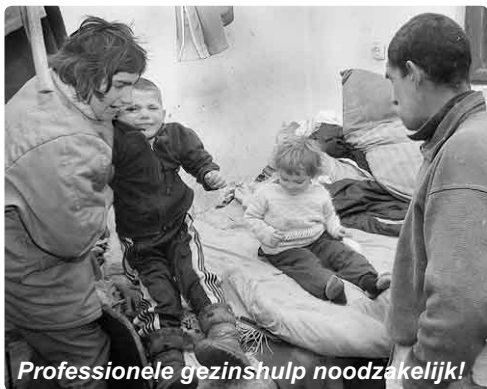
Professionele gezinshulp noodzakelijk!

in dit gezin elke vorm van structuur ontbrak. Temidden van een ongelofelijke bende, krijsende kinderen en radeloze ouders, stonden de medewerkers perplex bij het aanzien hiervan: hier is professionele gezinshulp noodzakelijk! Maar deze hulp ontbreekt ten enenmale in Oekraïne. Onze Oekraïense medewerkers gaven aan zich te willen ontfermen over dit gezin en gaan proberen enige orde te scheppen in de chaos. Allereerst door voedsel aan te bieden!