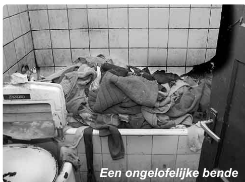
Een ongelofelijke bende

Op het tweede adres troffen de medewerkers een echtpaar met hun dochtertje aan. Dit dochtertje, één jaar oud, kampt met een ernstige nieraandoening. De ene nier was reeds uitgevallen en de tweede nier functioneerde niet naar behoren. Antibiotica was niet toereikend en een operatie bleek noodzakelijk. Met dit ernstige probleem waren de ouders naar de predikant gegaan. Een operatie, nodig in het veel duurder Hongarije, moet € 2000,00 gaan kosten, maar dit bedrag is voor hen niet op te brengen. Dit probleem werd met de OZO-medewerkers besproken en het volgende werd afgesproken: in de ker-