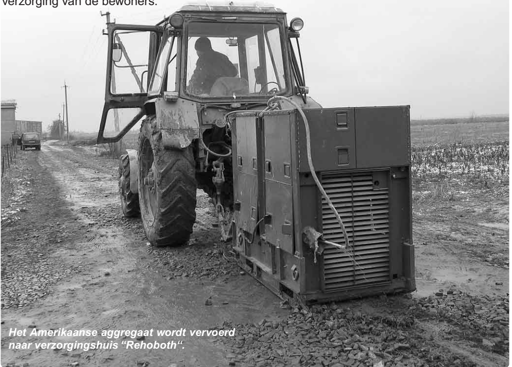
Het Amerikaanse aggregaat wordt vervoerd naar verzorgingshuis "Rehoboth".

In Nederland zijn we gewend op ieder moment van de dag elektriciteit te hebben. Dit is in Oekraïne niet het geval. De elektriciteit kan zomaar ineens uitvallen en zo snel als het verdwenen is ook weer terug komen. Soms kan dit ook voor langere tijd zijn, waardoor in verzorgingshuis "Rehoboth" problemen kunnen ontstaan. Het fornuis werkt niet meer, de kachels vallen uit, geen verlichting en nog tal van andere essentiële functies vallen weg die onmisbaar zijn bij de verzorging van de bewoners.