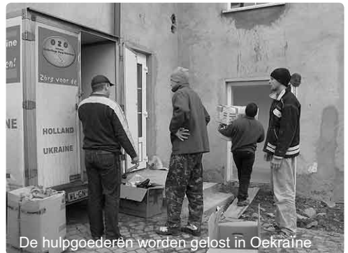
De hulpgoederen worden gelost in Oekraïne