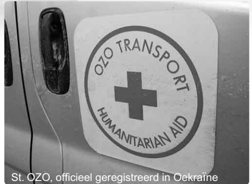
St. OZO, officieel geregistreerd in Oekraïne