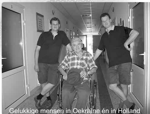
Gelukkige mensen in Oekraïne én in Holland