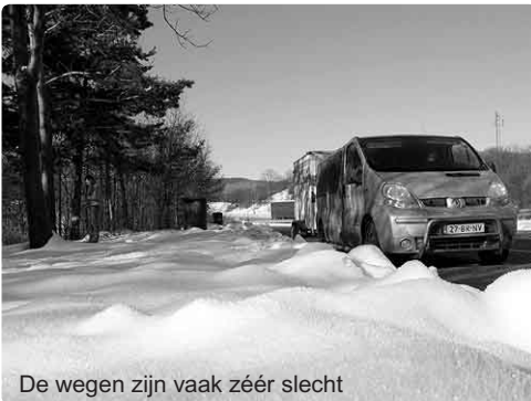
De wegen zijn vaak zéér slecht