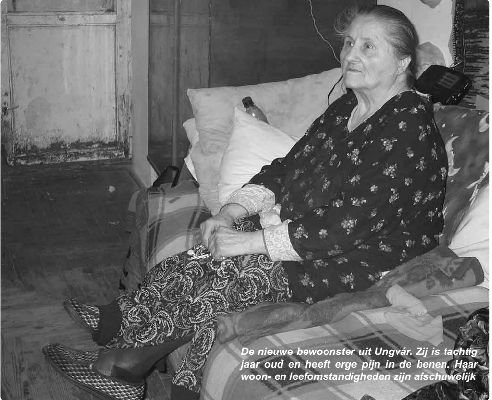
De nieuwe bewoonster uit Ungvár. Zij is tachtig jaar oud en heeft erge pijn in de benen. Haar woon- en leefomstandigheden zijn afschuwelijk