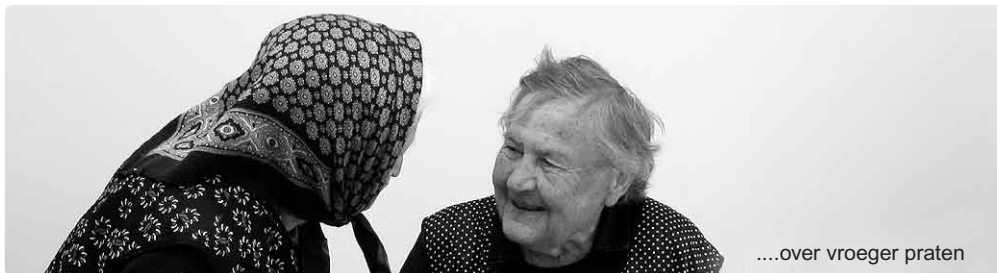
....over vroeger praten