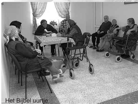
Het Bijbel uurtje

Zomaar een impressie over het leven in het verzorgingshuis. Gelukkige mensen in Oekraïne én in Holland. De Heere zegene hen en ons!