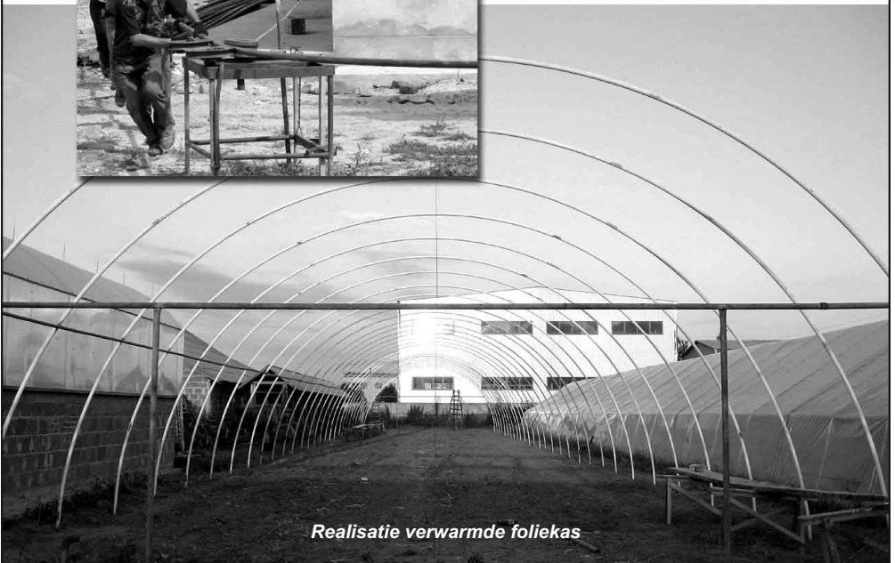
Realisatie verwarmde foliekas