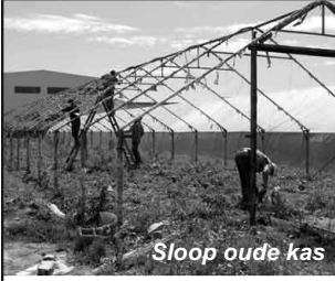
Sloop oude kas