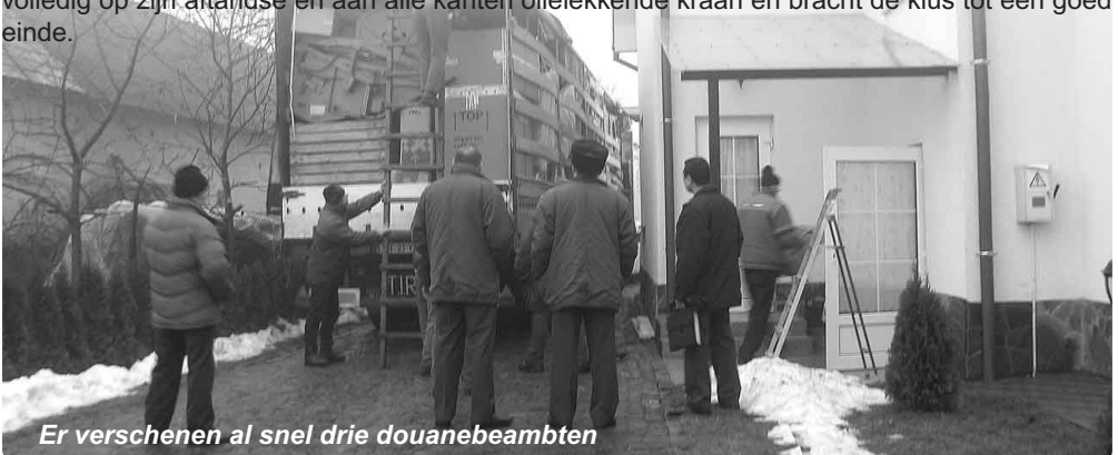
Er verschenen al snel drie douanebeambten

Het ambtelijk apparaat werkte in alle opzichten mee: er verschenen al snel drie douanebeambten die papieren en vracht controleerden en toestemming gaven om te lossen. De volgende dag reden we naar de boerderij. Het lossen van de maaidorsmachine uit de vrachtwagen bracht de nodige hoofdbrekens met zich mee, maar de stoïcijnse kijkende kraanmachinist vertrouwde volledig op zijn aftandse en aan alle kanten olielekkende kraan en bracht de klus tot een goed einde.