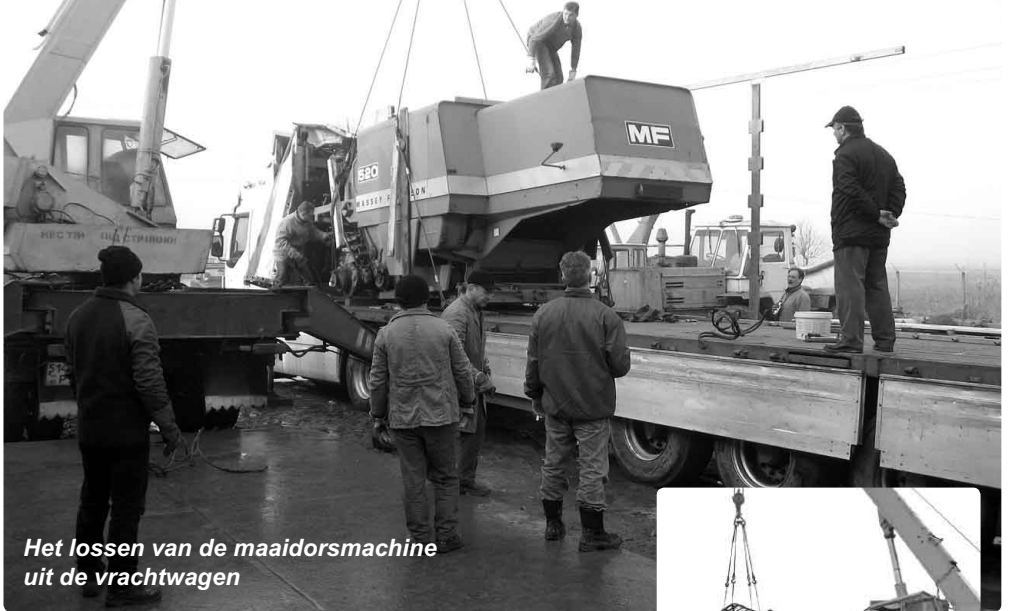
Het lossen van de maaidorsmachine uit de vrachtwagen

De maaidorsmachine werd van top tot teen bekeken en bewonderd. Menig agrariër kwam nieuwsgierig informeren en zij vroegen nu al om hun oogst te willen verzorgen! Na anderhalve dag hard werken was de oplegger leeg. Alles was heel en zonder ongelukken op de plaats van bestemming gekomen. Reden tot dankbaarheid!