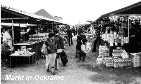
Markt in Oekraïne

De economie van Oekraïne leek ijzersterk: het bruto binnenlands product had in 2007 een toename van 7,3% en ook in de eerste negen maanden van 2008 bleef de economie in het spoor met een bbp-groei van 6,9%. Oekraïne had in 2007 aan directe buitenlandse investeringen een bedrag van 9,2 miljard dollar aangetrokken, een duidelijke verbetering met het jaar ervoor toen 5,7 miljard dollar binnenkwam. Het vertrouwen in de economie van het land was groot, wat ook viel waar te nemen op de effectenbeurs van Kiev.