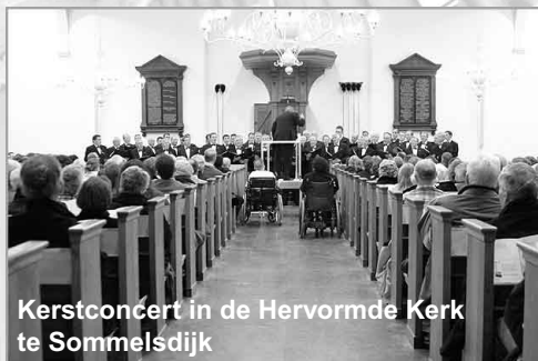
Kerstconcert in de Hervormde Kerk te Sommelsdijk

Onderling Contact info krant verschijnt 4 keer per jaar