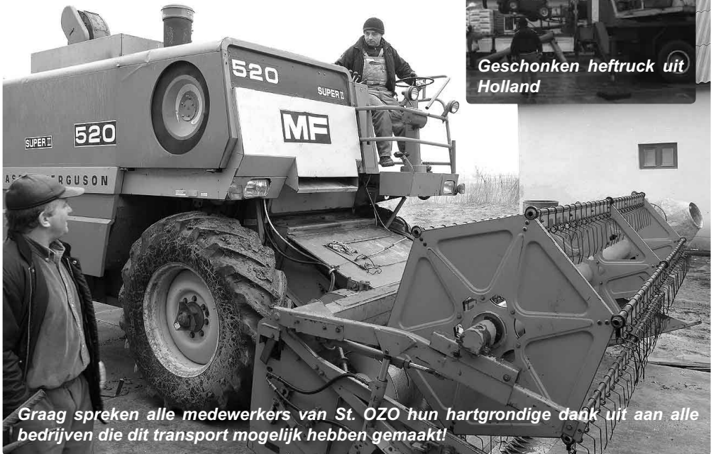
Graag spreken alle medewerkers van St. OZO hun hartgrondige dank uit aan alle bedrijven die dit transport mogelijk hebben gemaakt!