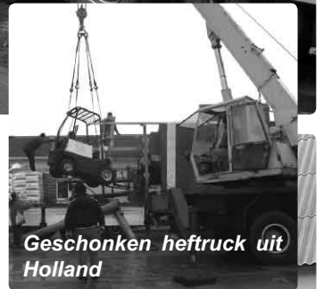
Geschonken heftruck uit Holland