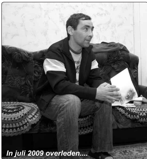
In juli 2009 overleden....