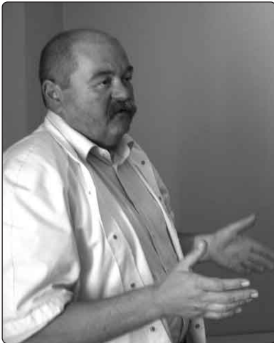
Een radiaallog die werkzaam is in de polikliniek, geeft uitleg over de zeer verouderde en gevaarlijke röntgen apparatuur uit het communistische tijdperk.