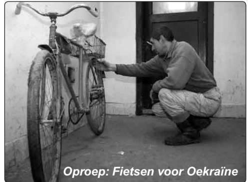
Oproep: Fietsen voor Oekraïne

Hoe spreken wij dankwoorden uit ten overstaan van zoveel medeleven. Alle donateurs heel hartelijk bedankt!