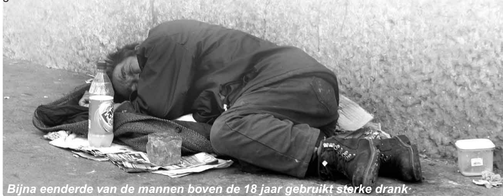
Bijna eenderde van de mannen boven de 18 jaar gebruikt sterke drank

Migratie. Behalve de slechte economische situatie liggen ook hier redenen waarom veel arbeidsmigranten niet naar hun vaderland terugkeren. Juni 2009 schatte het Ministerie van Arbeid hun aantal op 1,5 miljoen. Maar volgens de socioloog Ihor Markov in Kiev zijn het er 4,5 miljoen. Meer dan 600.000 burgers emigreerden sinds 1990 definitief naar het buitenland, met name Israël. Vermoedelijk is Oekraïne al stukken leger dan de officiële statistieken doen geloven.