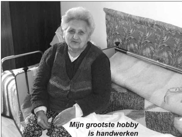
Mijn grootste hobby is handwerken

Ik werd heel zenuwachtig door de ontstane situatie en 's nachts werd ik gekweld door