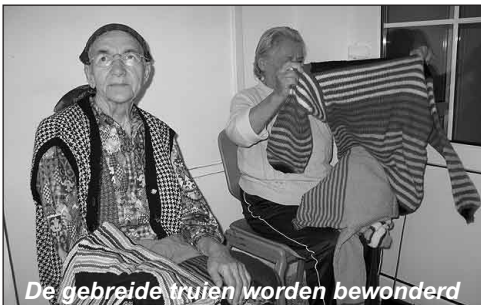
De gebreide truien worden bewonderd