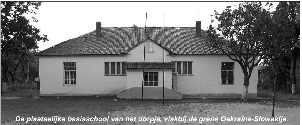
De plaatselijke basisschool van het dorpje, vlakbij de grens Oekraïne-Slowakije.

Weer 'thuis' (verzorgingshuis 'Rehoboth') bespraken we de mogelijkheden en toen gebeurde er een wonder. In een email vroeg een flakkeese sponsor of wij belangstelling hadden voor schoolmateriaal. Tafels, stoelen, bureaus, kasten en schoolborden, gratis af te halen!