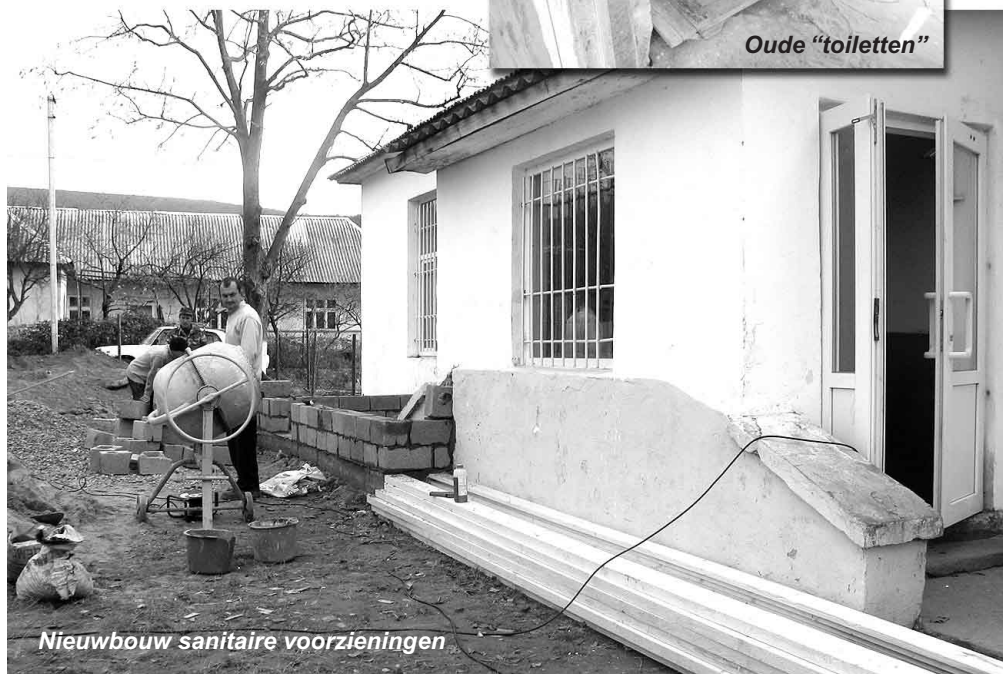
Nieuwbouw sanitaire voorzieningen