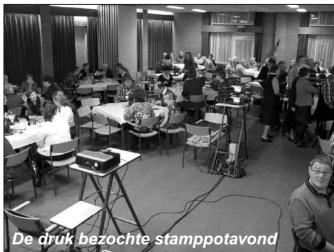
De druk bezochte stampotavond

Er was een stampotavond voor de gemeente, een ouderenmiddag met videopresentatie, een kerkdienst belegd door de mannenvereniging waar de eerste collecte voor Stichting OZO was en een verkoopdag door de jeugdclubs.