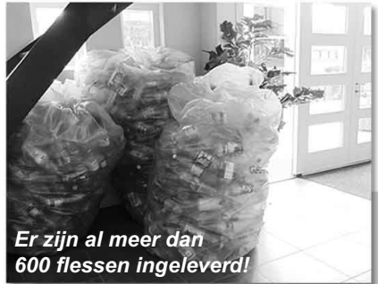
Er zijn al meer dan 600 flessen ingeleverd!

SBO 'de Wegwijzer' te Middelharnis zamelt geld in voor basisschool Járok!