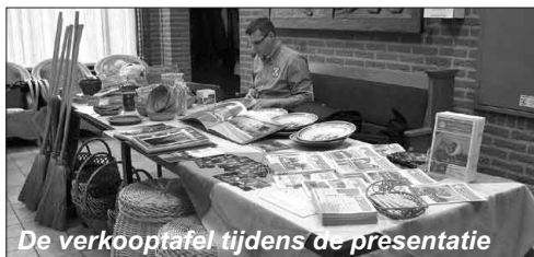
De verkooftafel tijdens de presentatie

Er was een stampotavond voor de gemeente, een ouderenmiddag met videopresentatie, een kerkdienst belegd door de mannenvereniging waar de eerste collecte voor Stichting OZO was en een verkoopdag door de jeugdclubs.