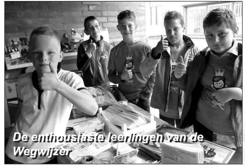
De enthousiaste leerlingen van de Wegwijzer