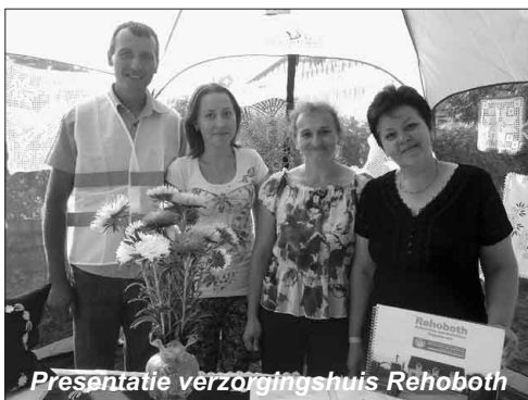
Presentatie verzorgingshuis Rehoboth

De bewoners keken al wekenlang uit naar deze dag, want wij presenteren ons als verzorgingshuis 'Rehoboth' natuurlijk ook op dit festijn! Alle bewoners werden piekfijn aangekleed en naar het dorp gereden om plaats te nemen in de 'Rehoboth' stand. Onder de heerlijk schijnende zon waren de dames bezig met handwerken en de heren praatten over vroeger. Heel enthousiast vertelden ze aan iedereen hoe fijn het is in het verzorgingshuis. Het is voor de bewoners heel goed om onder de mensen te zijn, ze zitten dan niet steeds in hun eigen wereldje. Aan het eind van de dag zijn ze helemaal uitgeput en komen moe maar voldaan thuis. Echt een dag waar veel saamhorigheid is en waar nog lang over nagepraat wordt!