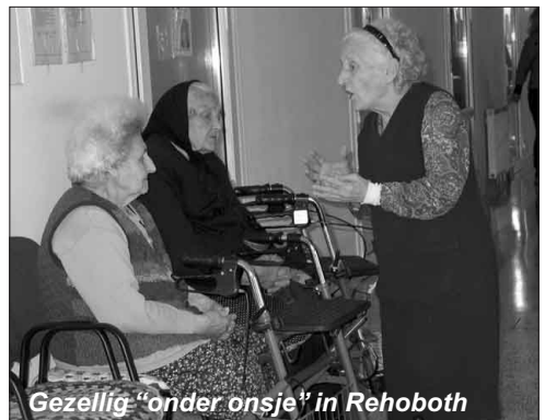
Gezellig "onder onsje" in Rehoboth

Voor ieders medeleven heel hartelijk dank!