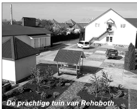
De prachtige tuin van Rehoboth