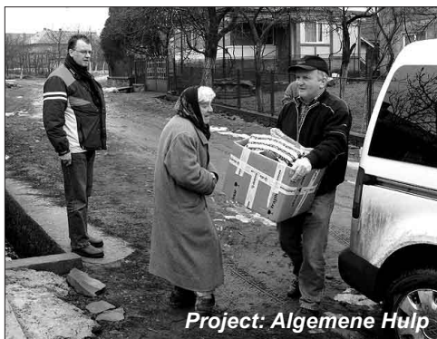
Project: Algemene Hulp