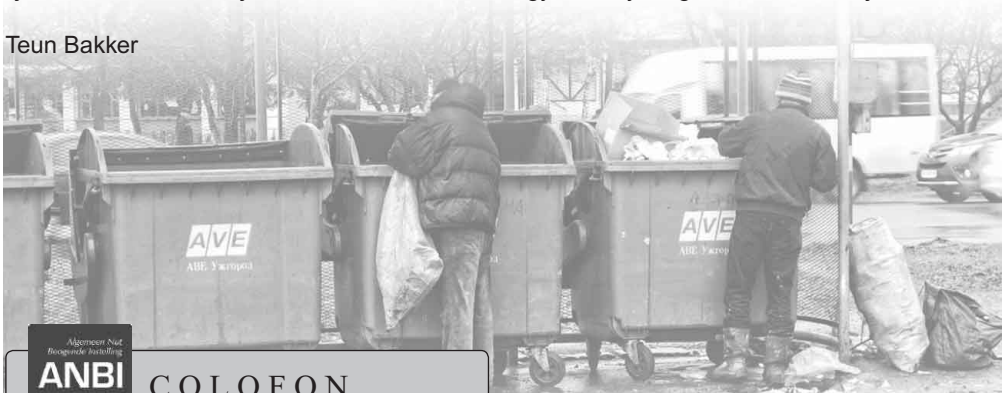
Zwerwers in Ungvár op zoek naar eten