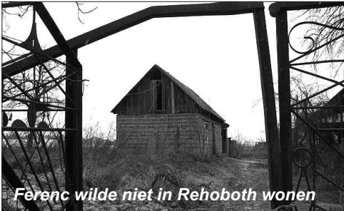
Ferenc wilde niet in Rehoboth wonen