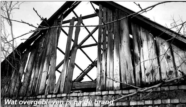
Wat overgebleven is na de brand