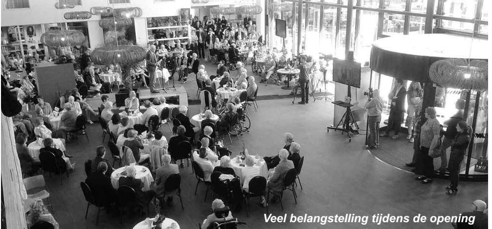
Veel belangstelling tijdens de opening

Twee medewerkers van Stichting OZO bemanden jl. 10 juni een OZO informatiestand tijdens de officiële opening van het nieuwgebouwde Woonzorgcomplex Nieuw Rijsenburgh te Sommelsdijk. Want, volgens een van de sprekers tijdens de opening, waar in deze nieuwe instelling veel ouderen kunnen wonen en verzorging ontvangen, zo zijn er ook op Goeree-Overflakkee stichtingen die in Oost-Europa ouderen hulp en verzorging bieden. Reden om alle genodigden, belangstellenden en (oud-) werknemers te verzoeken een gift te schenken aan twee eilandelijke stichtingen, Stichting OZO die hulp biedt in Oekraïne en Stichting Werkgroep Oost Europa die in Roemenië haar humanitaire werk heeft.