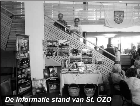
De informatie stand van St. OZO

In onze stand mochten we veel bekenden maar ook onbekenden vertellen en laten zien hoe mensen in Oekraïne moeten leven en wat wij daarin kunnen betekenen.