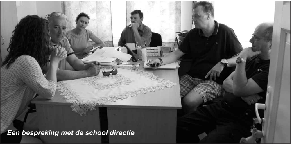
Een bespreking met de school directie

Een ander probleem op deze school is het ontbreken van schoon drinkwater. Tien jaar geleden is er een watersysteem met een onthardingsinstallatie aangebracht, maar deze blijkt al jaren niet meer te werken. Wél noodzakelijk voor zo'n grote school! We gaan ons hierover in de komende tijd beraden.