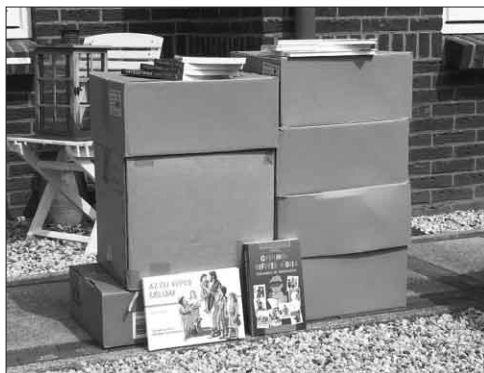
Nieuwe voorraad kinder bijbels voor scholen en kerkelijke gemeenten