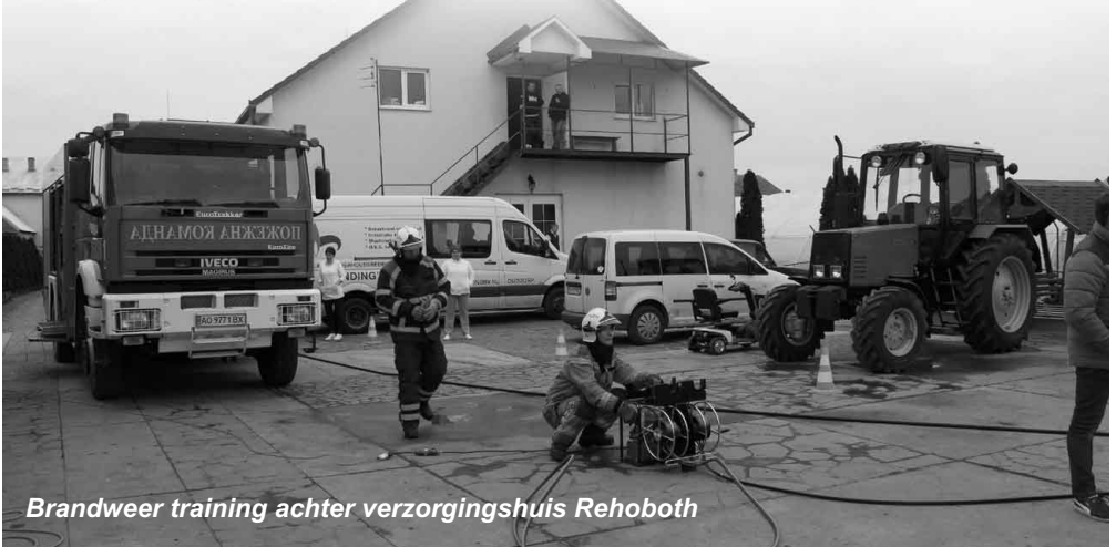
Brandweer training achter verzorgingshuis Rehoboth