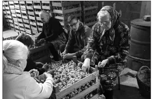
Bewoners verzorgingshuis Rehoboth helpen graag een handje mee