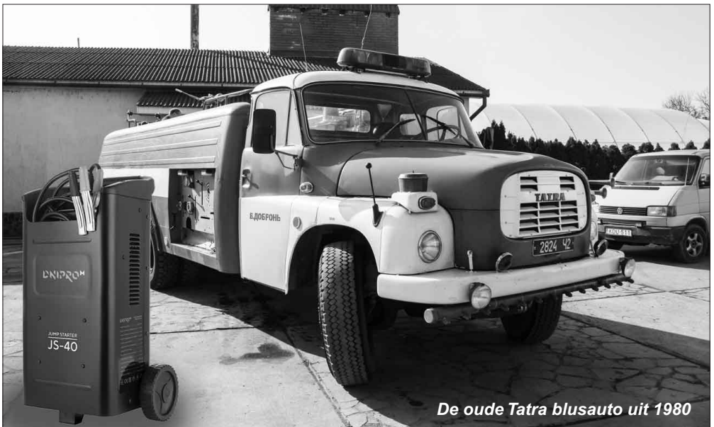
De oude Tatra blusauto uit 1980

S inds 2018 beschikt het brandweerkorps van Nagydobrony over een 'nieuw' blusvoertuig. Het betreft een Tatra 138 met als bouwjaar 1980. Een eenvoudige, maar geweldige auto,