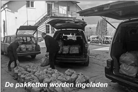
De pakketten worden ingeladen