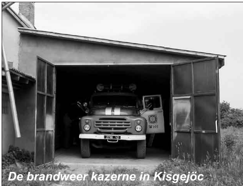
De brandweer kazerne in Kisgejök

De brandweerkazerne is gevestigd in een oude schuur naast een woning en is helaas niet voorzien van elektriciteit en dat is dringend nodig, omdat er geen verwarming aanwezig is. De elektriciteit is nodig om een klein kacheltje te laten branden, zodat in de winter de schuur vorstvrij kan blijven en dat er ook verlichting is.