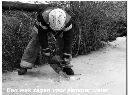
Een wak zagen voor aanvoer water