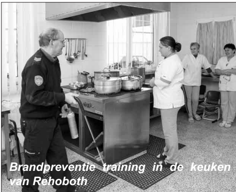
Brandpreventie training in de keuken van Rehoboth