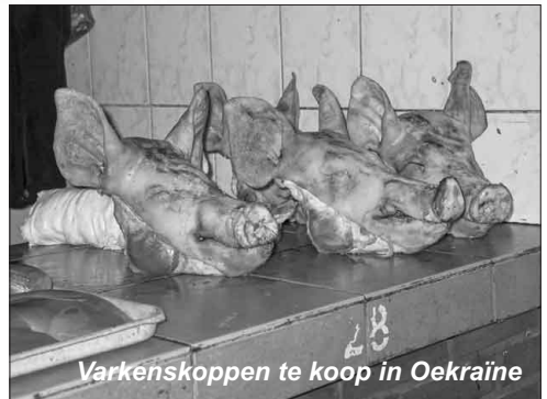
Varkenskoppen te koop in Oekraïne

Achter verzorgingshuis Rehoboth worden regelmatig varkens geslacht. Deze dieren worden gehouden op de boerderij. Het vlees is bestemd voor consumptie door de bewoners van Rehoboth en een gedeelte wordt verkocht. Het slachten van deze varkens krijgt iedere keer weer veel belangstelling van de bewoners, want het onderbreekt de dagelijkse sleur en het is natuurlijk toch wel een bijzonder gebeuren. Stel je eens voor dat de directeur en medewerkers van Nieuw Rijsenburgh hun eigen dieren zouden slachten onder toezicht van de bewoners! Huisslacting gebeurt vaak in de dorpen. Of het allemaal volgens de Europese normen geschiedt, blijft gissen. Volgens onze Oekraïense medewerkers is deze vorm van slachten wel de enige garantie voor een goed stuk vlees. Op de foto's is te zien dat met een brander het haar van de dieren wordt weg geschroeid en de Hollandse Kärcher maakt de boel schoon. Op de plaatselijke markten zijn het vlees en de varkenskoppen terug te vinden.