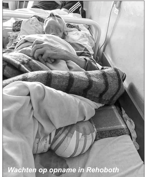
Wachten op opname in Rehoboth

Mede door COVID-19 is de nood onder de ouderen buiten Rehoboth heel hoog. Velen waren al eenzaam omdat hun kinderen in het buitenland werken en wonen en niet zoveel op bezoek konden komen. Deze eenzaamheid wordt nog versterkt doordat nu in de coronatijd bezoek nauwelijks meer mogelijk is. Veel bejaarden leven daardoor in armoediger omstandigheden en er is weinig uitzicht op verbetering omdat bijvoorbeeld vaccinatie vooralsnog niet voor iedereen mogelijk is. Rehoboth zou een goede plaats voor deze mensen zijn maar helaas komen er nauwelijks plaatsen vrij. De wachtlIJst voor het verzorgingshuis is ondertussen gegroeid tot 30 hulpzoekenden.