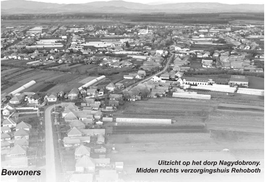
Uitzicht op het dorp Nagydobrony. Midden rechts verzorgingshuis Rehoboth