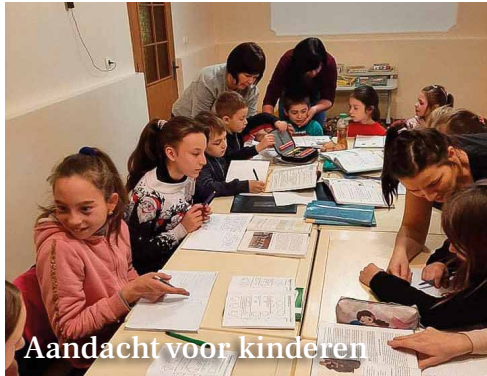
Aandacht voor kinderen

gaan ze in "The Shelter" onder de douche. Sommige kinderen wonen wel in een huis maar dat huis is gewoon leeg. Ze slapen in of op een kartonnen doos want een bed in de slaapkamer kennen ze niet. Als de kinderen in "The Shelter" zijn of als ze mee-