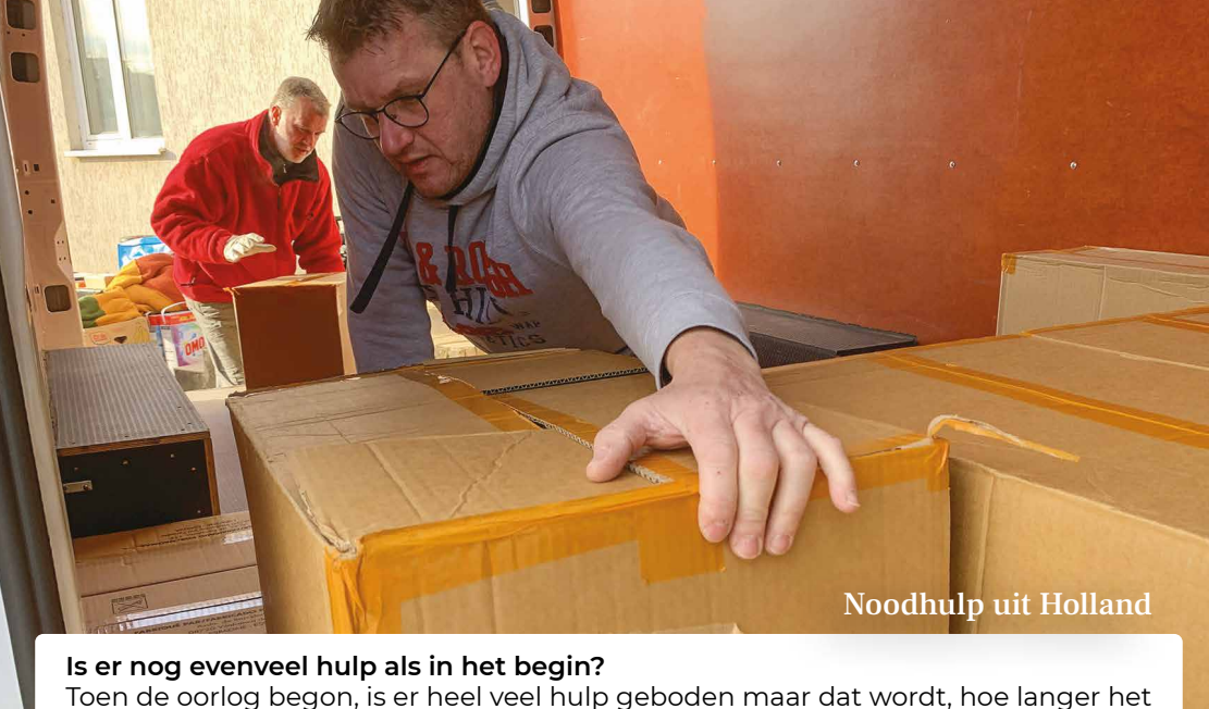
Noodhulp uit Holland