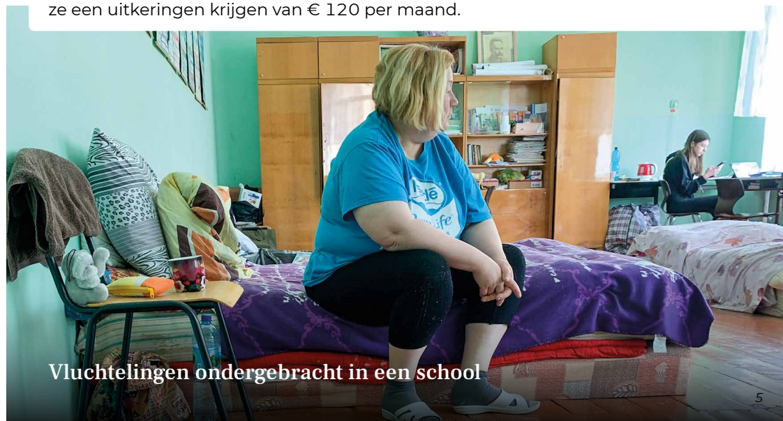
Vluchtelingen ondergebracht in een school

Ja dat wel, vanuit sociale zaken krijgen we ook een bijdrage. Iedereen die hier heenvlucht wordt geregistreerd en ook het adres waar ze wonen. In de toekomst zal deze registratie digitaal gebeuren via de overheidssite. Als ze geregistreerd zijn kunnen ze een uitkering krijgen van € 120 per maand.