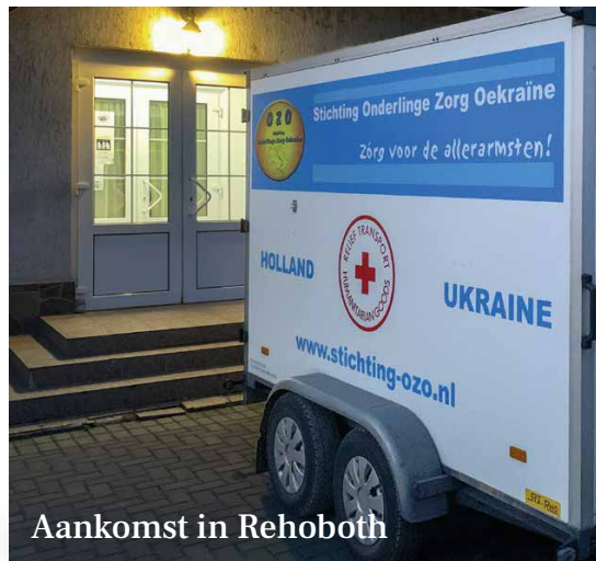
Aankomst in Rehoboth