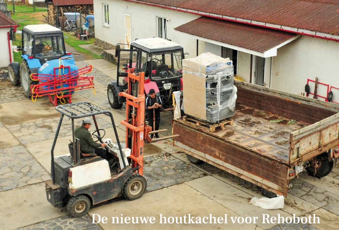
De nieuwe houtkachel voor Rehoboth