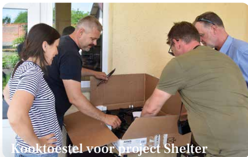
Kooktoestel voor project Shelter