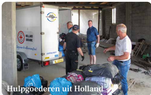
Hulpgoederen uit Holland