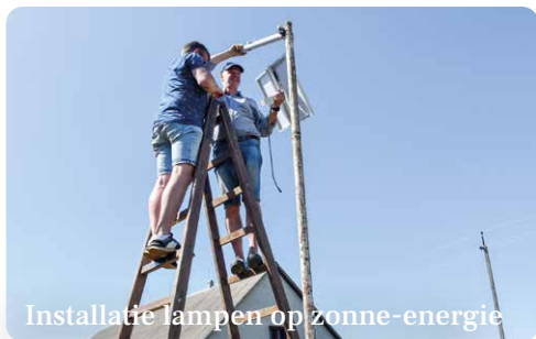
Installatie lampen op zonne-energie