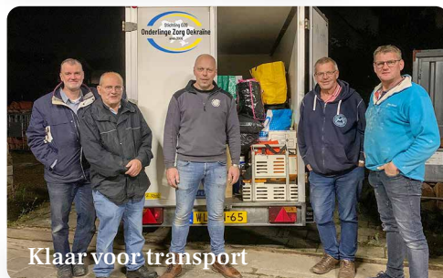
Klaar voor transport