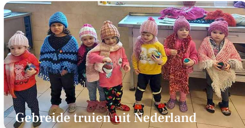
Gebreide truien uit Nederland