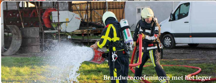
Brandweeroefeningen met het leger