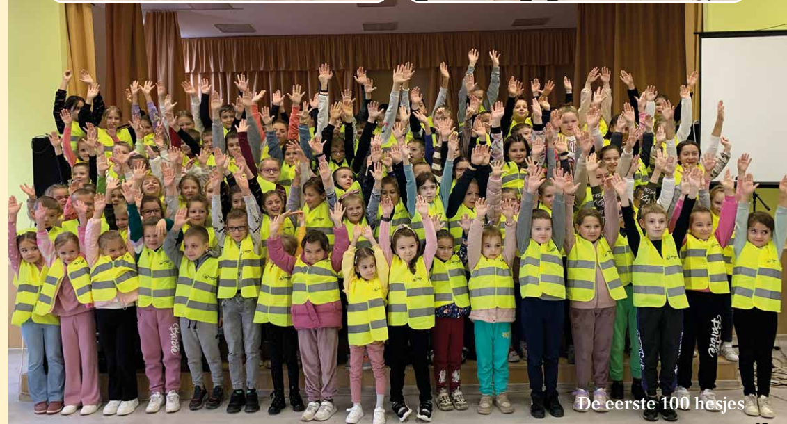
De eerste 100 hesjes