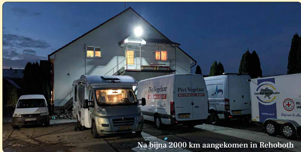
Na bijna 2000 km aangekomen in Rehoboth

dagen voorzien van verlichting en (kracht)stroom. Naast het elektrisch materiaal dat in Nederland werd aangekocht en gereedschap was er ook nog ruimte voor de 'gebruikelijke goederen', zoals incontinentiemateriaal, medicijnen en verbandmiddelen. Later zal een arts deze zaken controleren en bekijken wat er in Rehoboth kan worden gebruikt en wat geschikt is voor bijvoorbeeld de plaatselijke polikliniek. Verder zal een deel van de verbandmiddelen en pijnstillers aan het leger worden overhandigd. Een uitgebreid -dagelijks- verslag is nog te lezen op de website: www.stichting-ozo.nl onder het kopje 'volg ons'.