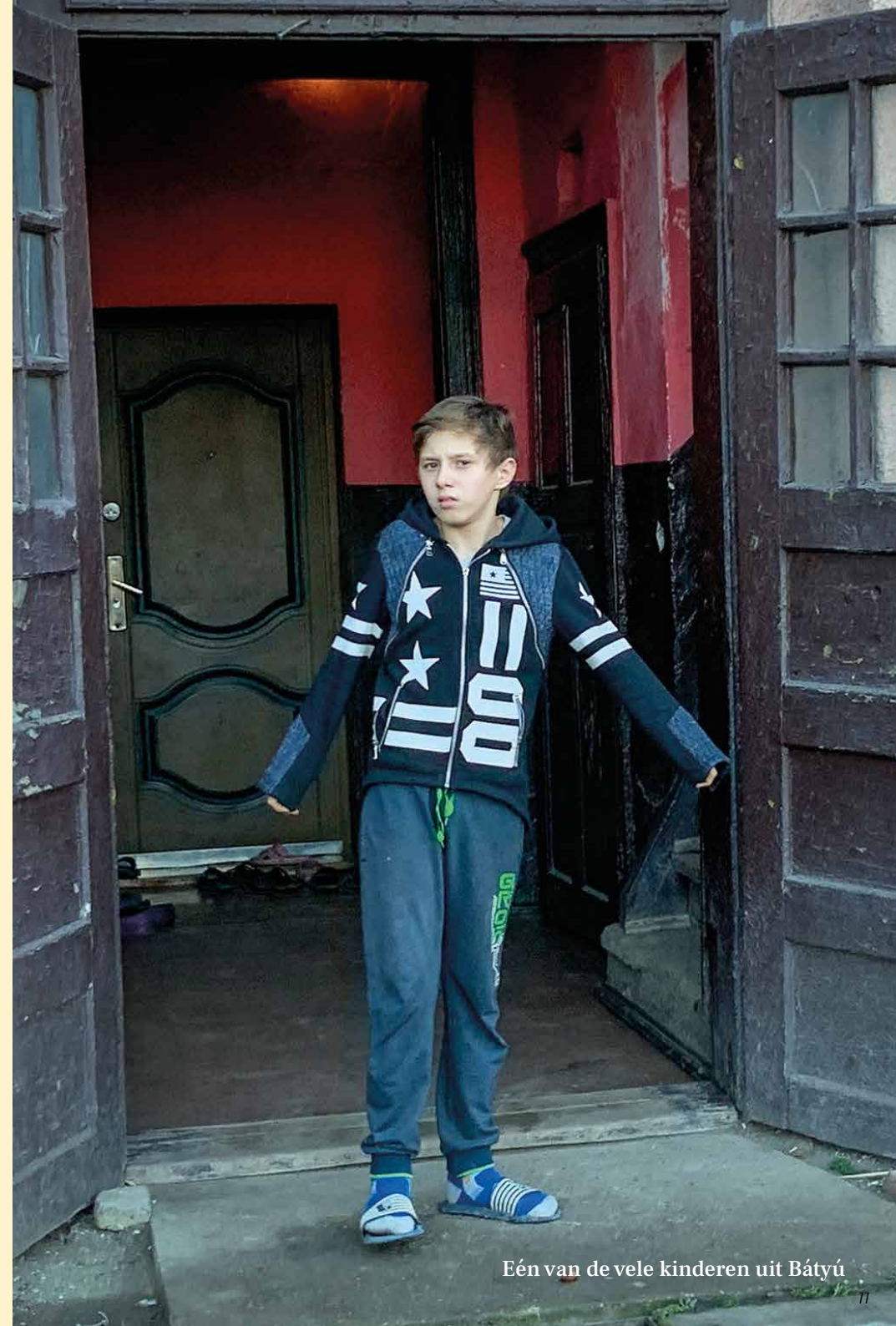
Eén van de vele kinderen uit Bátyú