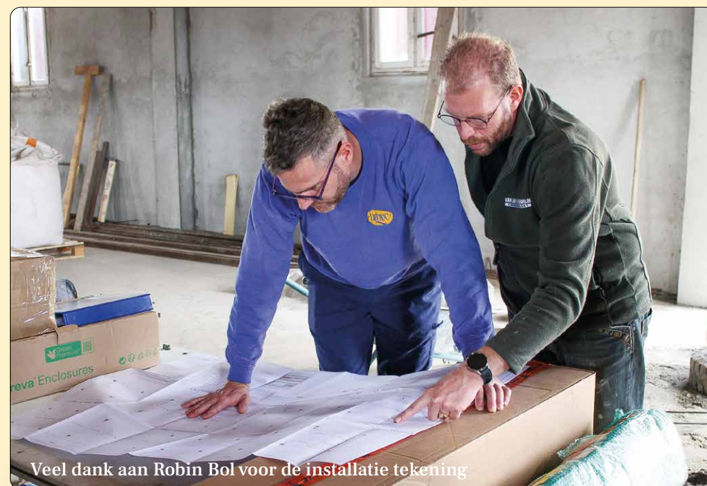
Veel dank aan Robin Bol voor de installatie tekening