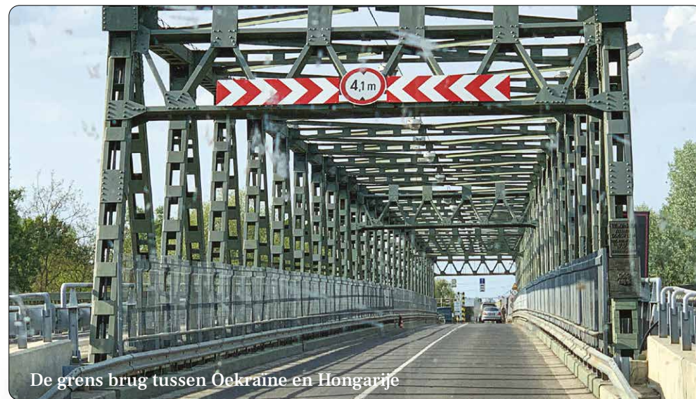
De grens brug tussen Oekraïne en Hongarije