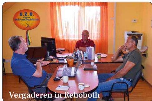
Vergaderen in Rehoboth