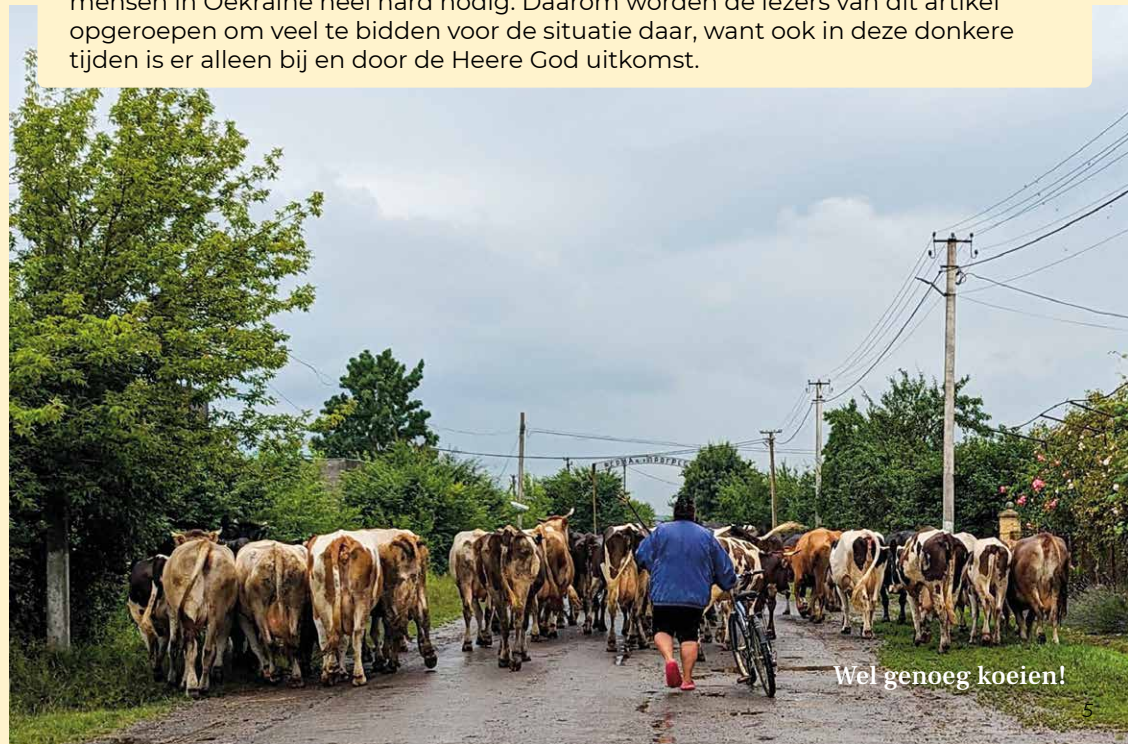
Wel genoeg koeien!

De realiteit is dat er nood is op verschillende niveaus. Daarom is gebed voor de mensen in Oekraïne heel hard nodig. Daarom worden de lezers van dit artikel opgeroepen om veel te bidden voor de situatie daar, want ook in deze donkere tijden is er alleen bij en door de Heere God uitkomst.