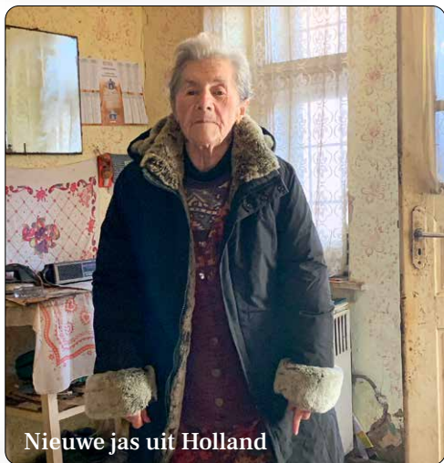
Nieuwe jas uit Holland