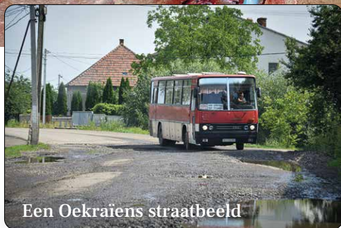
Een Oekraïens straatbeeld