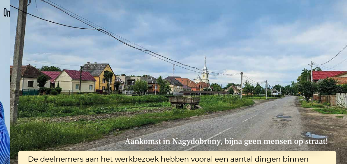
Aankomst in Nagydobrony, bijna geen mensen op straat!

De deelnemers aan het werkbezoek hebben vooral een aantal dingen binnen Rehoboth kunnen doen, zoals het herinrichten van het magazijn en het sorteren van de goederen. Ook zijn er naast andere klussen vooral uitgebreide gesprekken met de directie gevoerd. Want juist in deze tijd van de oorlog en de gevolgen daarvan vraagt een goede voorbereiding op eventuele -onverhoopte- veranderingen in de organisatie in Oekraïne. Toch heerst er altijd weer een weemoedig gevoel bij de deelnemers aan het werkbezoek als er weer wordt teruggegaan naar het westen, waar er vooralsnog geen oorlogsdreiging is en waar ook nog een zekere welvaart heerst.