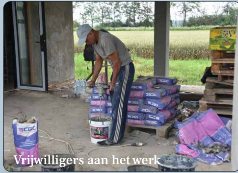
Vrijwilligers aan het werk