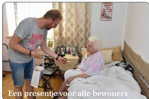
Een presentje voor alle bewoners