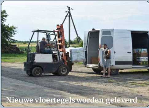
Nieuwe vloertegels worden geleverd