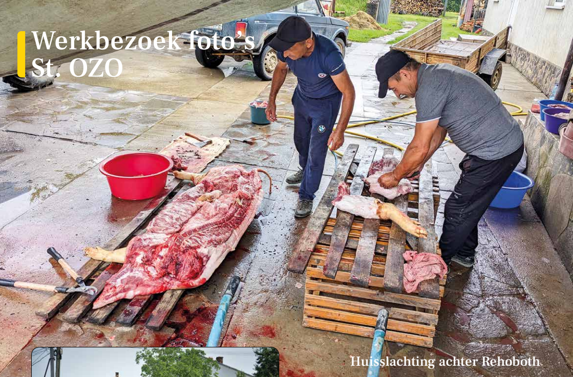
Huisslaching achter Rehoboth